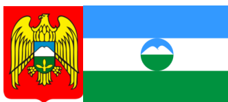
God?o i flaga Kabardo-Ba?karii